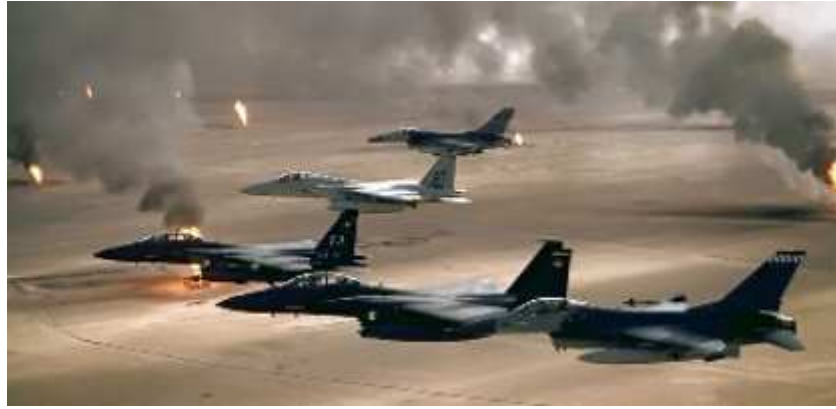
Survol d'avions de chasse américains au dessus du Koweït lors de l'opération Desert Storm.

2003 -2004 : problème, dans résolution 687 on avait demandé de désarmer l'Irak mais que le conseil de sécurité soit maintenu. Dans résolution 687, l'Irak doit détruire ses mines. La résolution 1441 a été le fruit d'un compromis. Les Américains avaient proposé un compromis qui disaient que toutes les résolutions qui avaient été prises auparavant permettraient de trancher le conflit. Refusé.